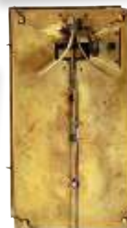
Orologio a pendolo